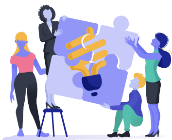
Travaux de groupe